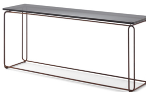
Couchtisch: 105 x 25 cm Tischplattenfarbe: Parsolglas Gestellfarbe: Edelrost