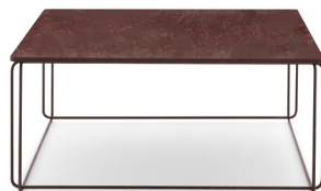
Couchtisch: 80 x 80 cm Tischplattenfarbe/Gestellfarbe: Edelrost