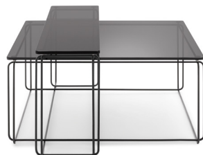
Couchtisch: 80 x 80 cm und 105 x 25 cm Tischplattenfarbe: Parsolglas Gestellfarbe: Tiefschwarz RAL 9005